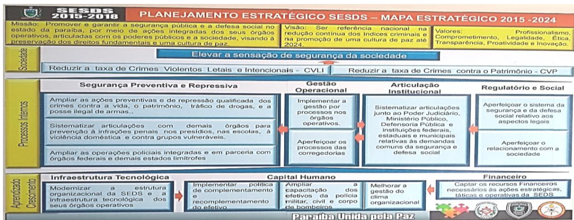
Figura 1 – Mapa estratégico do SESDS.

Quanto à missão, a Polícia Militar visa promover e garantir a segurança pública e a defesa social no estado da Paraíba, por meio de ações integradas dos seus órgãos operativos, articuladas com os poderes públicos e com a sociedade, visando à preservação dos direitos fundamentais e uma cultura de paz. No tocante à visão, a entidade pretende ser referência nacional na redução contínua dos índices criminais e na promoção de uma cultura de paz até 2024. Por fim, em relação aos valores, destacou-se: o profissionalismo; comprometimento; legalidade; ética; transparência; proatividade e inovação.